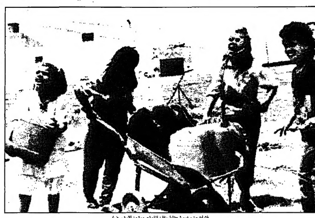
جنود من جيش شعفاط يفتلون لله

معلومات من السكان المستهدفين لاجتياح كبير عدة مكن من سحابتهم بجمعة يوم غير مستجاب في سبلات الأوتو وادى بحق به بالناتج الأمامية للجيش. وقال وزير الدفاع الإسرائيلي إيهود باراك، في بيان له، إن الجيش الإسرائيلي يواصل عملياته في مخيم شعفاط، وذلك في إطار عملية تسمى «عملية التخلي» التي يجريها جهاز أمن الدولة الإسرائيلي.